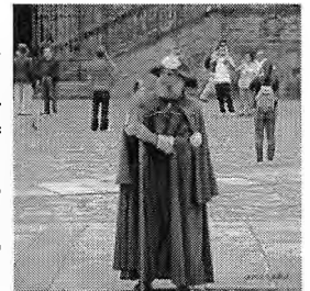
Een méér dan typische compostelavaarder

Het Spaanse pelgrimsoord Santiago de Compostela verwacht in 2010 een record aantal pelgrims. Ieder jaar bezoeken miljoenen mensen het graf van de apostel Jacobus en beëindigen duizenden pelgrims hun voettocht, de 'camino de Santiago'. Vorig jaar werden door het pelgrimsbureau in Santiago 125.000 oorkondes uitgereikt aan pelgrims, die in ieder geval de laatste 100 kilometer te voet of de laatste 200 kilometer per fiets hadden afgelegd. Dit jaar verwacht men bijna het dubbele aantal. 2010 is voor Compostela een bijzonder jaar. Voor de 119e keer sinds het begin van de pelgrimstraditie naar Santiago in de 12de eeuw is het een Heilig jaar. De sterfdag van de apostel Jacobus op 25 juli valt op een zondag en pas in 2021 zal dat weer het geval zijn. Op oudejaarsdag opende aartsbisschop Julian Barrio de heilige deur van de kathedraal met drie hamerslagen en luidde daarmee het 'Xacobeo 2010'-jaar in. In het vorige Heilig Jaar 2004 kwamen meer dan twaalf miljoen bedevaartgangers naar Santiago. Dit jaar zullen dat er meer zijn. Vanwege de verwachte toeloop zullen er iedere dag vijf missen opgedragen worden en zullen er tien nieuwe herbergen worden geopend. (jm)