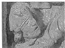
Detail van het St.-Jorisretabel (Brussel - 1493)

De voornaamste aspecten van de Vlaamse retabels, hoofdzakelijk vervaardigd tussen