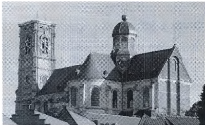
De imposante abdijkerk domineert het hele landschap