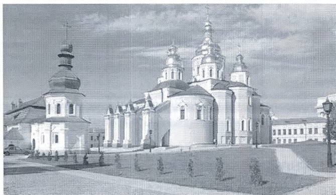
Het Holenklooster, parel van de orthodoxie

Het wereldbepaalde holenklooster in Kiev (Oekraïne) is er zo slecht aan toe dat monniken en architecten hebben aangedrongen op snelle actie om het complex voor instorten te behoeden. Het klooster, dat met zijn goudkleurige koepels al bijna duizend jaar boven de Oekraïense hoofdstad uittorent, wordt ondermijnd door regen, sneeuw, kwelwater en verwaarlozing. Monniken stichtten het holenklooster, dat zijn naam ontleent aan de talrijke ondergrondse gangen, in 1051 nabij de rivier de Dnjepr. Het werd langzamerhand de belangrijkste heilige plaats van de orthodoxe christenen in Oost-Europa.